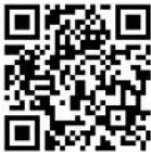
北海道内の地域ESD拠点 (2024年3月現在・登録順)

地域ESD拠点は地方センターのパートナーとして、他の地域ESD拠点とも連携し、各地域・各分野で取り組まれるESDを様々な形で支援します。登録をお考えの皆さまは、ぜひ地方センターにご相談ください。