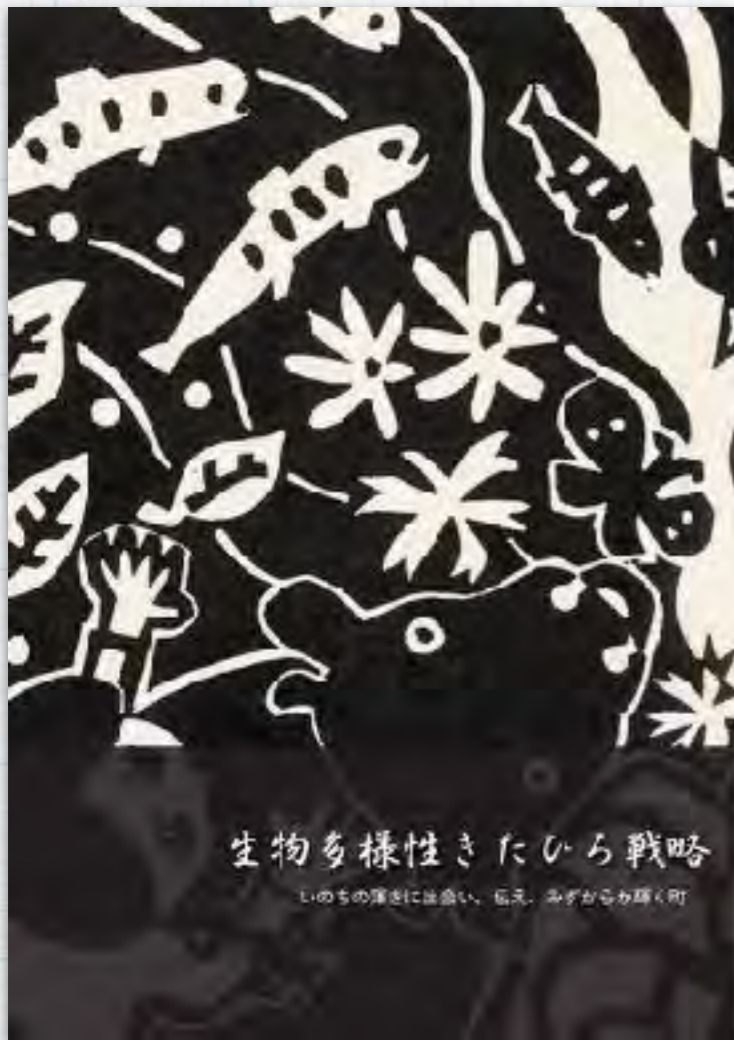
生物多様性保全条例 (生物多様性戦略)