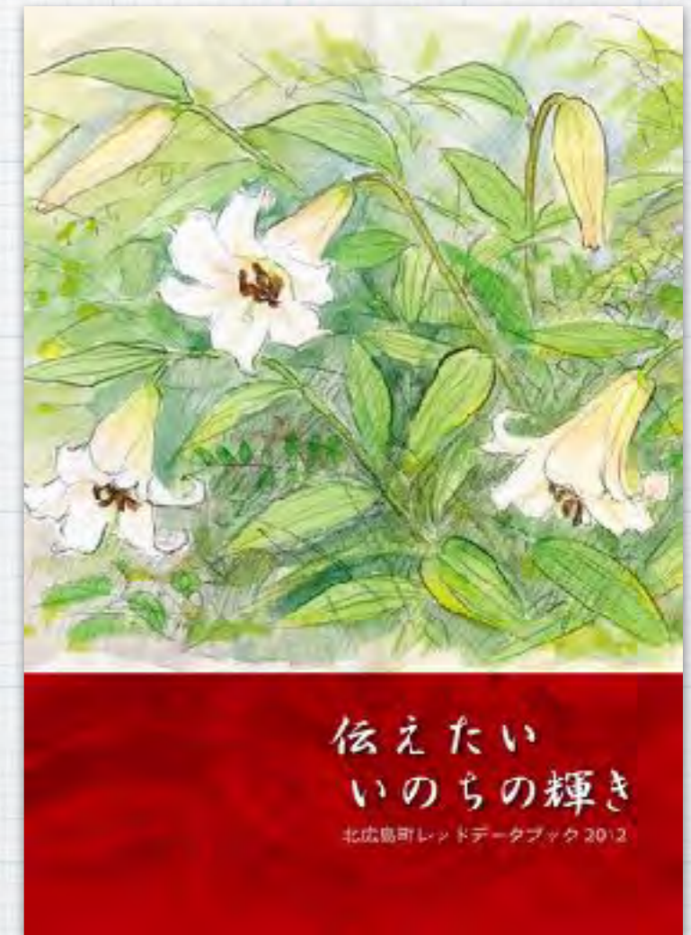
レッドデータブック