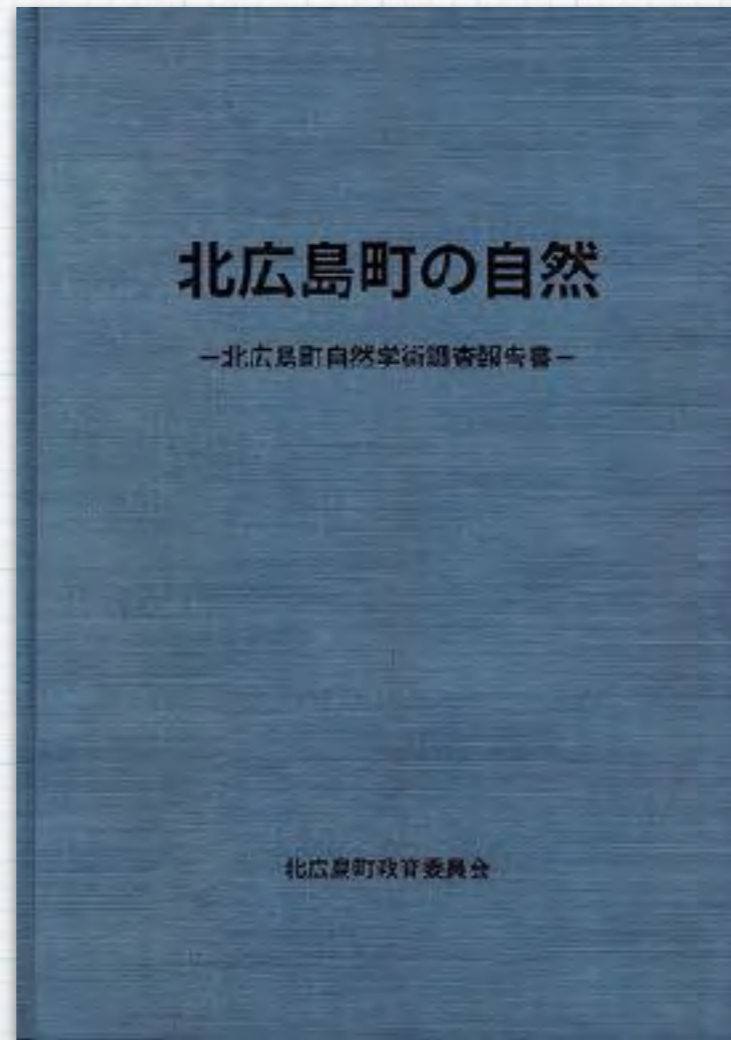
町内の全生物データ