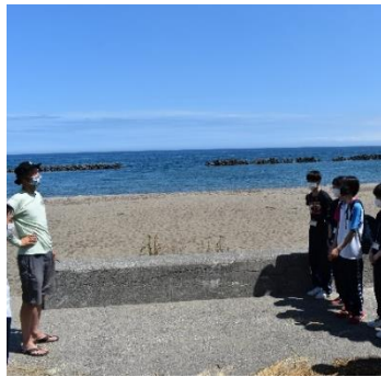
モニターツアー 7/2, 7/14