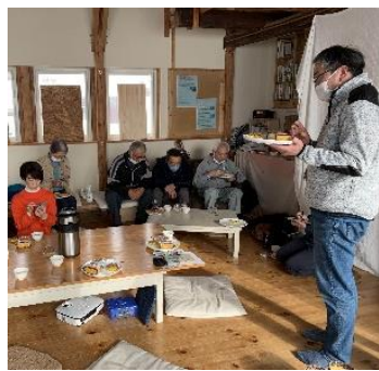
余市りんご 研究会 1/19