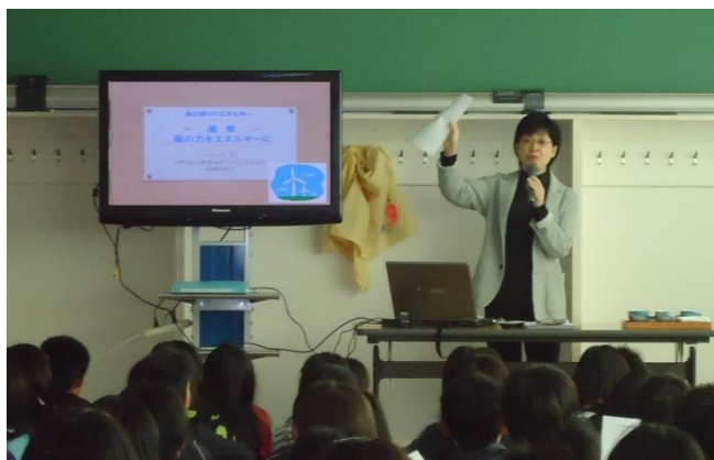
NPO 法人北海道グリーンファンドさんがお話ししました。

今年度は「私のくらしに大切なもの」という単元で指導計画を立てました。11 月より都道府県知事が委嘱する地球温暖化防止活動推進員、市民の手による再生可能エネルギーの推進を手掛ける NPO 法人北海道グリーンファンドや NPO 法人ひまわりの種の会などから外部講師を迎え、授業を展開しています。