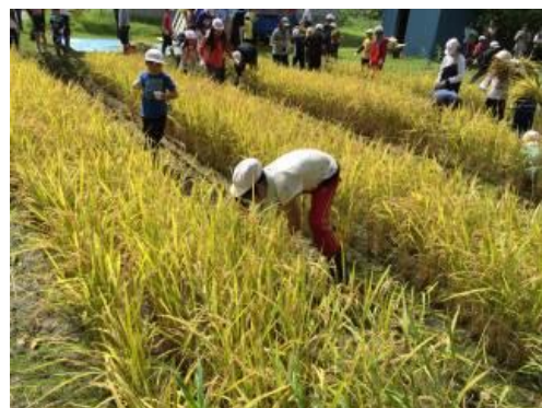
ユネスコファームと学校田の活動を展開しています（石狩市立生振小学校 HP より）