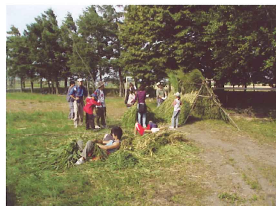
先住民のクチャ作り(2006年8月)

TECは、この環境の村のフィールドとなる当別町に事務所を置いていることもあり、環境の村でのESDの活動が当別町全体に広がり、一つの町が持続可能な社会に向かっていくための教育活動に力を注いでいます。具体的な活動としては、子ども向けのキャンプやセミナー、指導者養成、フォーラムといった事業を行い、環境教育の手法や考え方を実践しながら培っているところです。また、2004年と2005年には環境教育をテーマにした学校教育とNPO法人との連携のあり方を検討する文部科学省の研究事業に参加し、年間50時間ほどの授業を小学校・中学校・高校で行ってきました。この縁で、今でも毎年町内の学校で授業をさせていただいております。2005年には、環境省の事業として「環境学習をテーマとしたエコミュージアム構想」を実施し、当別町というフィールドのポテンシャルを見極めることが出来ました。