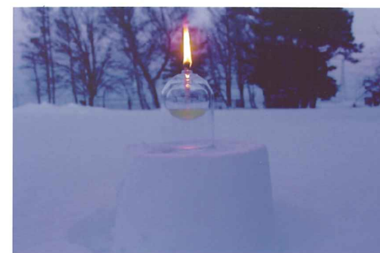
ヒマワリから油(2006年8月)

このような5年の蓄積の上に、今年取り組んでいるESD当別プロジェクトがあります。まさに、この活動に取り組むことは、私たちTECにとってのミッションでもあるのです。また、昨年より「冬水田んぼ」をキーワードとした農業に頼らない農業や牧畜のあり方について、地元の農家さんはもちろん、企業、行政の方々と一緒に取り組みを始めました。様々な役割を持つ主体が、一つの目標を共有しながら、互いに学び合う場がこの「冬水田んぼ」での取り組みであり、私たちTECにとっての環境教育ワーキングネットでもあります。ESD当別プロジェクトはこの延長でもありますが、単なる延長ではなく、オルタナティブな教育や社会づくりを目指しています。