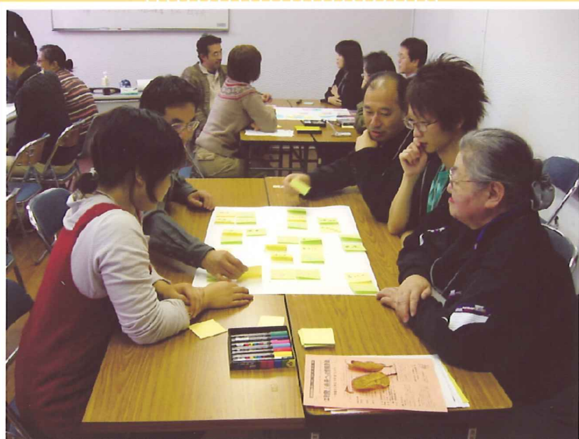
江別 ESD ワークショップより(2006年11月)

さ っぽろ自由学校「遊」は、「市民がつくる市民に開かれたオルタナティブな学びの場」として札幌を拠点に活動している市民活動団体(NPO)です。具体的には、環境・開発・人権・平和・多文化共生などをテーマに年間30コース程度の連続講座を開催している他、映画上映会や講演会などの公開イベントの開催、国内外へのスタディツアーの実施、ブックレットの出版など様々な形で市民の教育・学習活動を行っています。