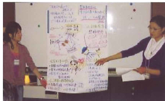
帯広 ESD ワークショップより(2006年10月)

2006年度には、帯広・函館・江別の3地域で、参加者が実際に地域の現状を調べ発表しあう参加型