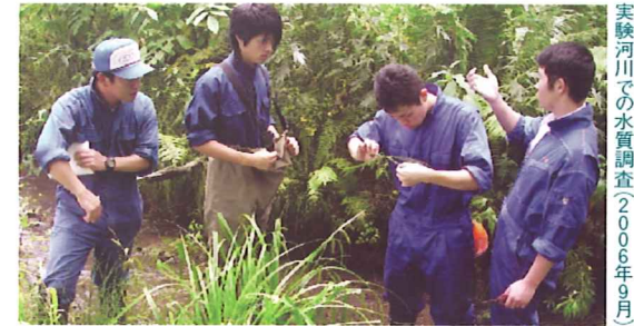
実践 河川での水質調査(2006年9月)

ラムサール条約登録湿地のひとつである釧路湿原では、現在自然再生事業の推進が検討されてい