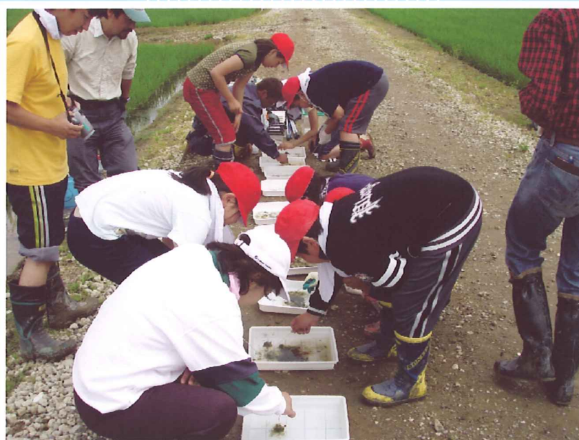
冬水田んぼの生きもの調査(2006年8月)

石 狩当別に事務所を置くNPO法人当別エコロジカルコミュニティ(TEC)が中心となり、当別町というフィールドを活かした、ESD当別アクションプラン作り(環境省ESD促進モデル事業)を行っています。