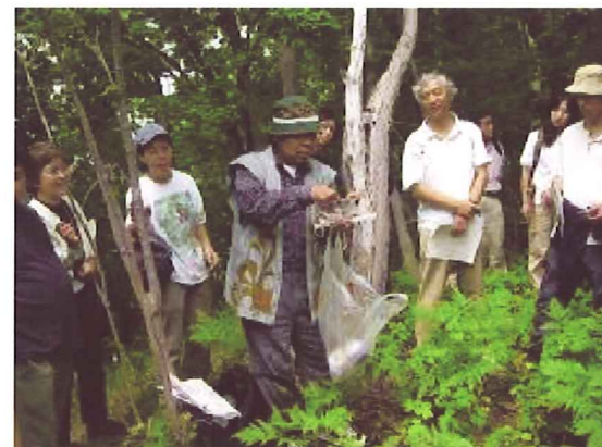
シロトコ先住民族エコツアー風景(2006年7月)